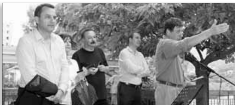
Les élus de Bastia, les parents et les élèves, lors de l'inauguration de la cantine de l'école René Subissi

La question est encore et toujours celle de la qualité.