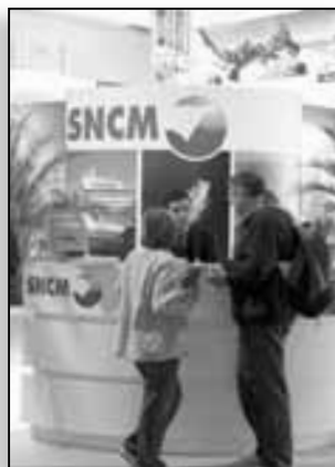
Une autre ambassadrice de la Corse à la Fête de l'Humain

L'arrière-saison s'annonce excellente. Nous avons monté une opération commerciale intitulée « L'automne en Corse », que nous espérons pérenniser et étoffer en y intégrant, dès l'année prochaine, Air Corsica. Pour cette année, en partenariat avec les compagnies maritimes, nous avons travaillé autour d'un packaging bateau/hôtel. 5000 places à prix plancher - très attractif - sont proposées dans ce cadre. Nous communiquerons là-dessus dans quelques jours. A terme, nous avons dans l'idée de travailler aussi, avec les grandes villes françaises, autour d'événements forts. Réunir les îles de Méditerranée tous les deux ans pour des échanges de savoir-faire et d'expériences, est un de nos projets. Et nous continuons d'accompagner I Muvrini dans leur tournée internationale puisque nous serons avec eux pour 3 concerts en Suisse, en Belgique et en Allemagne. L'idée est de faire des choses qui se voient davantage, sachant que nous sommes sur une destination très attractive.