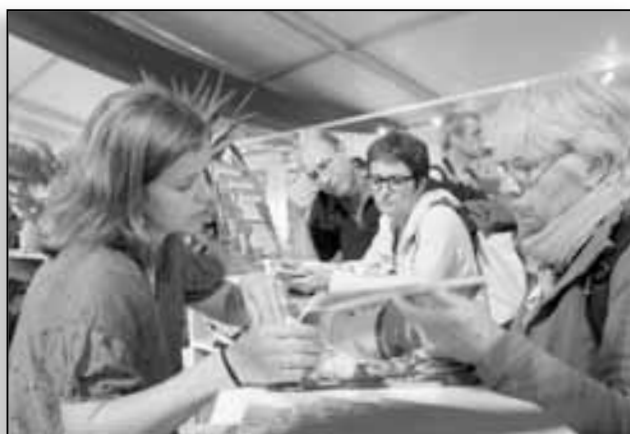
Corsica Tours, un des partenaires de l'ATC présents à la Courmeuve

Nous avançons sur cette question comme sur les autres. Le 6 octobre prochain, je présenterai ma feuille de route à l'Assemblée de Corse. Elle s'articule autour des grands chantiers que sont le recentrage des missions de l'agence, la structuration de l'offre touristique, la fiscalité dont je viens de parler, mais elle comprend aussi un axe « formation